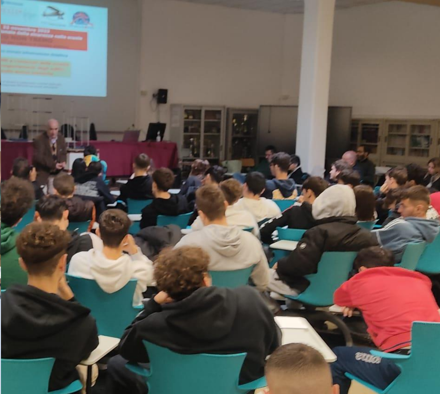
Rieti, 20 novembre 2023 – Nel laboratorio «Misure» e in Aula Magna dell'I.I.S. «Celestino Rosatelli»