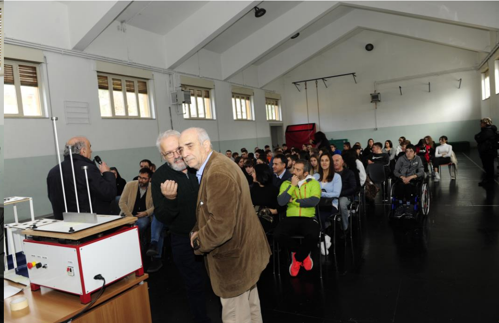
Borgorose «Cicolano», 22 novembre 2023 – Incontro nella palestra dell'Istituto Onnicomprensivo Borgorose