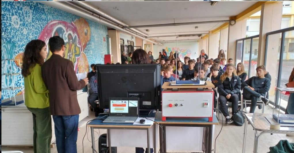
Roma-Ostia, 21 novembre 2023 – Portico Liceo Scientifico «Antonio Labriola» Postazione «RISCHIO SISMICO»