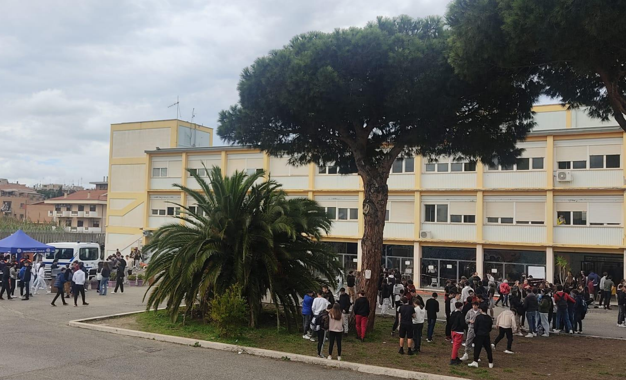
Roma-Ostia, 21 novembre 2023 – cortile tra il Liceo Scientifico «Antonio Labriola» e il Liceo Classico «Anco Marzio»