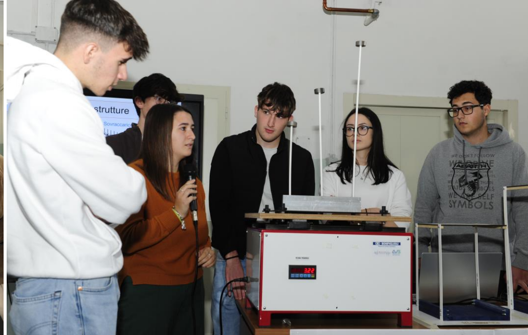
Borghese «Cicolano», 22 novembre 2023 – Incontro nella palestra dell'Istituto Onnicomprensivo Borghese